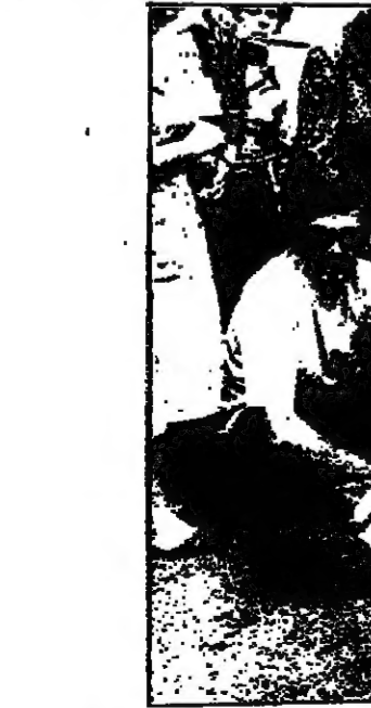
مسألة مورود قد هجمتها المنظمة السياسية ولم تلت نتائجها وتقريرها بالشكل الذي كانت تنظره الاوية الحمراء.

المجموعات السرية كالعادة ان تستغل خصاصة الجمهور وتلزم على المواطنين من حيث تصويتهم. اما العمل الثاني فيلتمبل في موجة من التوقيفات لم يسبق لها مثيل، ففي كل اسبوع تحوز الشرطة الايطالية باجمات طيبة ضد الاوية الحمراء، وغيرها من المنظمات والخجومات ويبدو ان عدة شبكات سرية قد تقطعت عراها في ان واحد من هنا الهجة المملكة للارهابيين